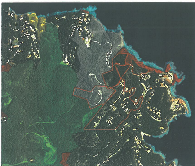
Ordenació del Pla Especial de protecció del medi natural i del paisatge Muntanyes de Begur amb l'àmbit la Modificació Puntual del POUM (1:5000). En gris el polígon de connexió (clau 5 del PE)

En relació al Pla Especial de protecció del medi natural i del paisatge de Muntanyes de Begur (en endavant Pla Especial), aprovat inicialment el 28 de juny de 2010, hi ha un àmbit que resulta afectat: el Puig Rodó, en la seva totalitat, on la modificació puntual del planejament municipal es preveu mantenir la qualificació com a Zona Verda però amb un sector de serveis tècnics, un vial, ampliable i adaptable a les necessitats futures. En aquest cas el sector si que es troba inclòs en l'àmbit del Pla Especial com a zona de connexió (clau 5). En cap cas això implica que aquesta peça es trobi inclosa a dins dels límits del PEIN, si bé és un connector important previst en el àmbit del Pla Especial per mantenir uns fluxos biològics en un espai natural ja de per si prou fragmentat.