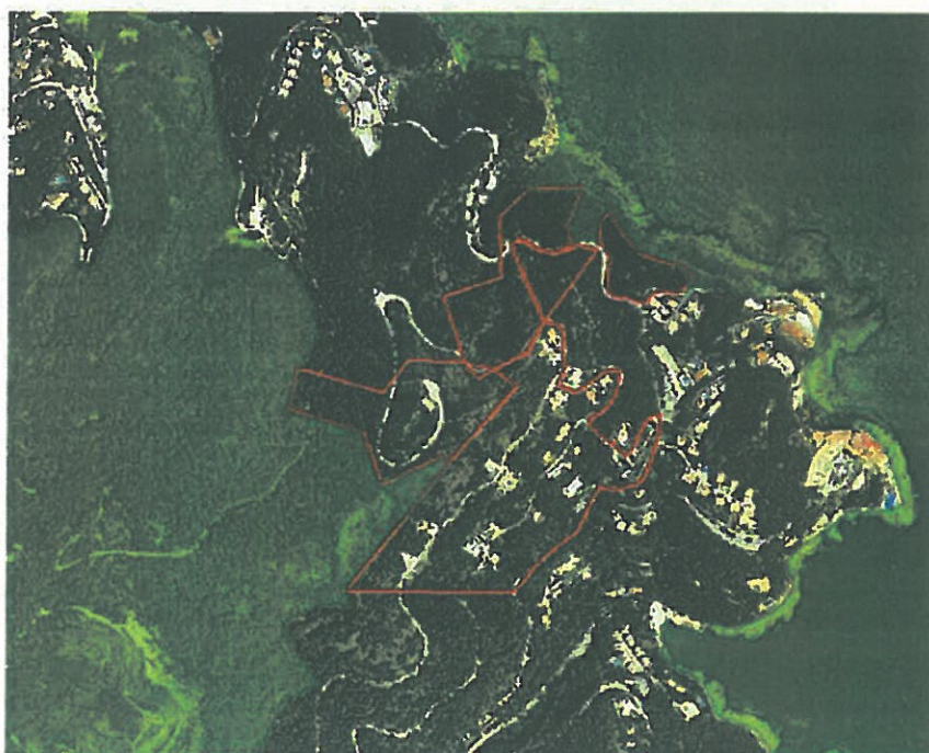
Delimitació de l'espai del PEIN i al Xarxa Natura 2000 prevista en el Pla Especial en verd on es veu que no solapa amb l'àmbit de la Modificació del POUM (1:50000) en vermell, i que es manté com a sòl no urbanitzable.