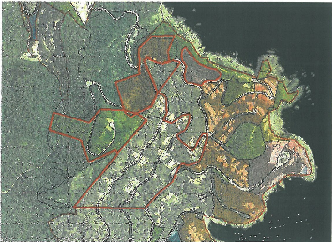
Ambit de les peces afectades per la Modificació Puntual del POUM ( P-14 Aiguafreda)

Concretament, la proposta de modificació afecta a als polígons P-14, P-14.2, P-14.4, AA-Puig Rodó i AA-14 de la urbanització d'Aiguafreda